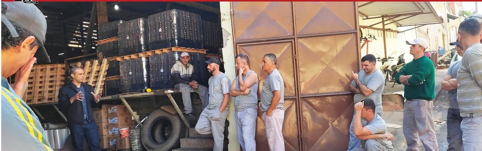
Orientada pelo Sindicato dos Metalúrgicos, PiaZZi & Doro garante mais segurança aos funcionários